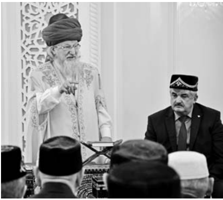
Продолжение, начало на с.1

В своем вступительном слове Верховный муфтий затронул наиболее важные вопросы сегодняшнего состояния российской уммы. Речь, в частности, шла о том, что ввиду кризисных, нагнетаемых американской политикой ситуаций в Сирии, Ираке, а в последнее время и на Украине, все больше в стране создается псевдоисламских структур, и задача имама - местного проповедника традиционного Ислама, уметь разъяснить своей пастве его разницу по отношению с радикализмом, предотвращать возникновение экстремистских ячеек. Служитель мечети со всей ответственностью должен выполнять свой религиозный и гражданский долг – учить людей добрососедству, толерантности, веротерпимости и братству.